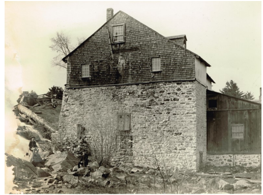
Le moulin seigneurial à Papineauville..